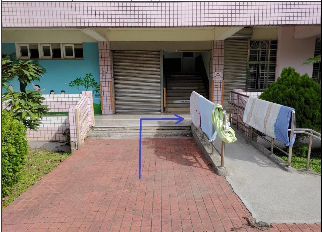
2. 於西側水池旁步道進入第一棟南走廊。