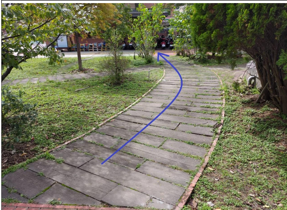
2. 西側水池旁步道→警衛室後方走道。