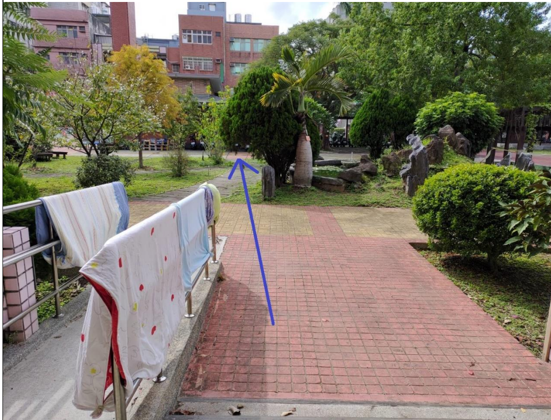
1. 第一棟南走廊西側→西側水池旁步道。