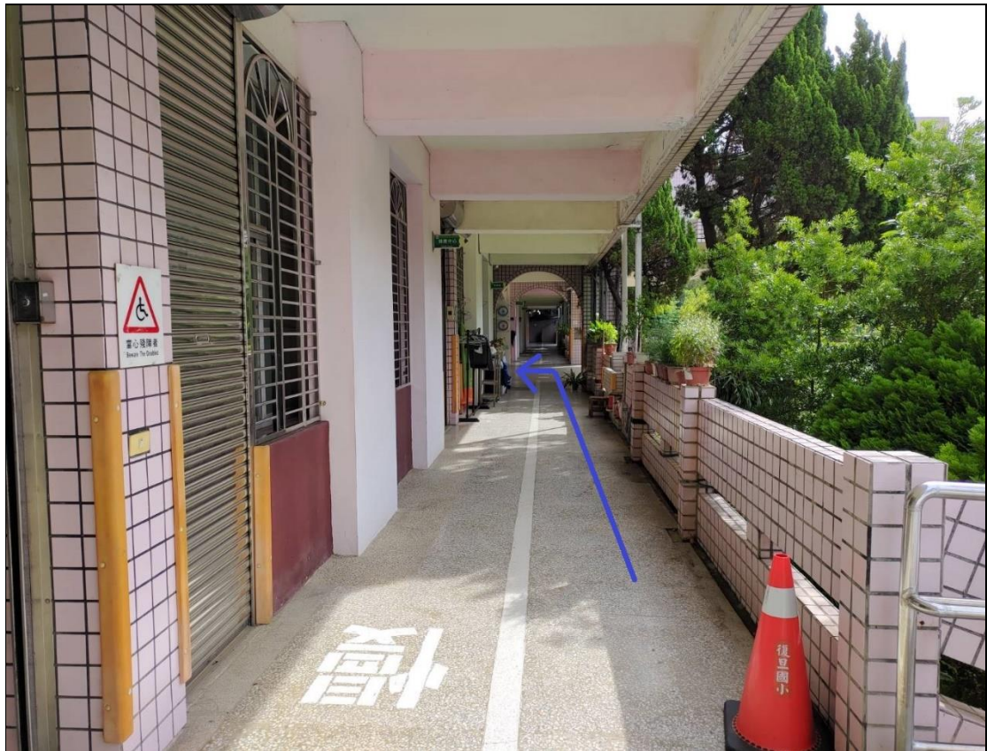
3. 再至穿堂進入原防疫動線。