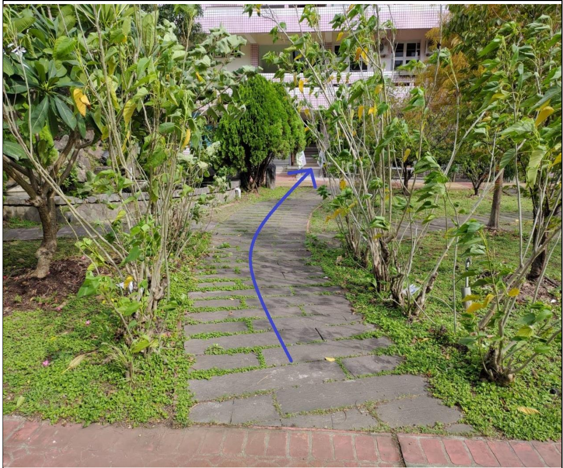
2. 於西側水池旁步道進入第一棟南走廊。