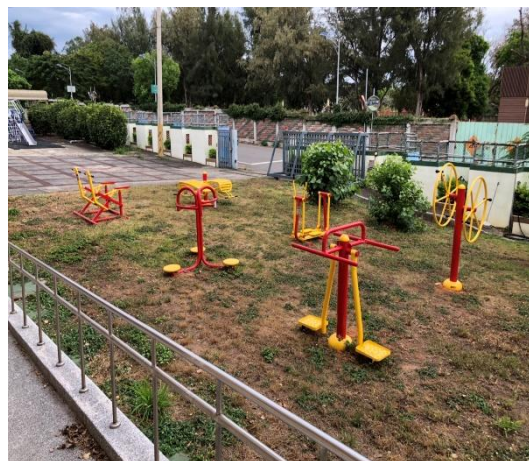
宿舍外有籃球場及遊樂設施