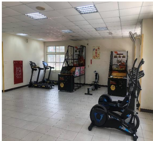
一樓設有籃球機、健身器材