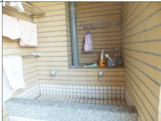
寢室設有洗衣台及曬衣空間