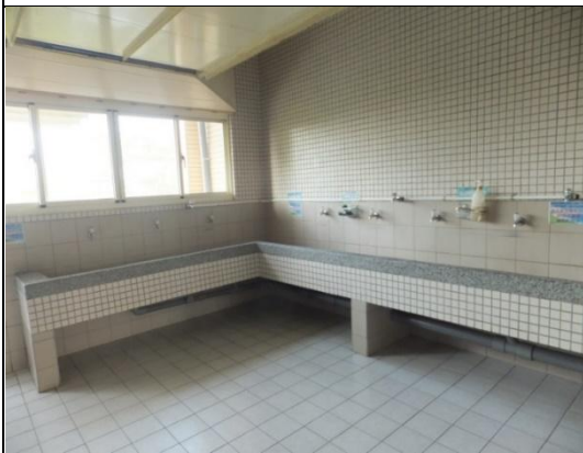
公共區設有洗衣空間和脫水機